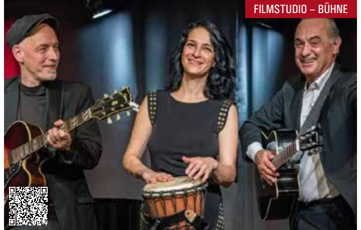
FILMSTUDIO – BÜHNE