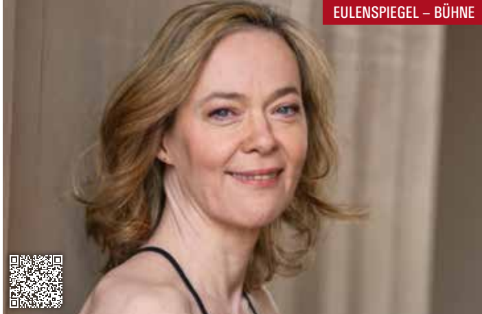
EULENSPIEGEL – BÜHNE